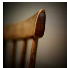
Stolen är i massiv björk eller ek. Medan vissa exemplar är trärena finns de även i rött, blått och svart.

Slöjden låg honom varmt om hjärtat och han hade många idéer