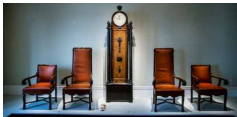
Carl Malmsten slog igenom när han vann tävlingen om att få inreda delar av Stockholms stadshus. Här är möblerna som pryder Rådssalen.