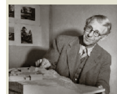
Carl Malmsten var enormt produktiv. I år är det 50 år sedan han dog.