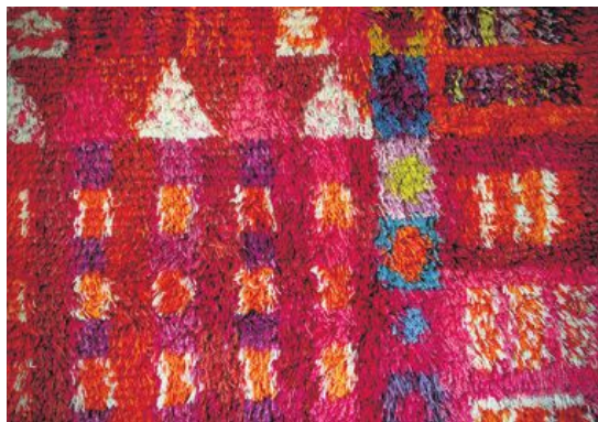
Ryamattan "Guldslottet" av Marianne Richter.