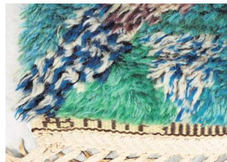
Ryamattan ”Fjädersn grönt” mäter 253 x 191 centimeter och är komponerad av Marianne Richter för MMF. Ett exemplar finns på Nordenfjeldske Kunstinstitutet, Trondheim.