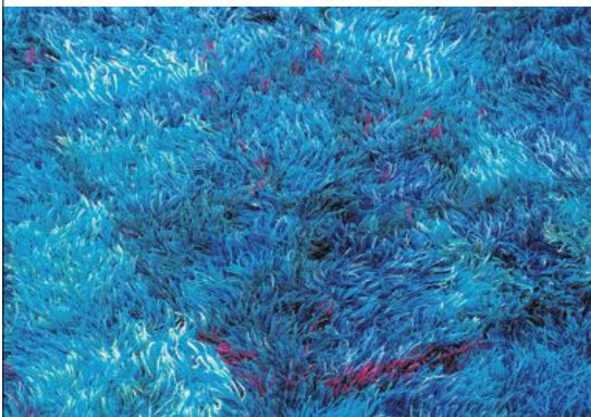
Ryamattan "Blå månen" mäter 252 x 177 centimeter och är komponerad av Viola Gråsten 1949, för NK Textilkammare. Ett exemplar finns i Röhsska museets samlingar.

Källor: Svenskt kvinnobiografiskt lexikon, Scandinavian Retro, Märta Måås-Fjetterströms ateljé