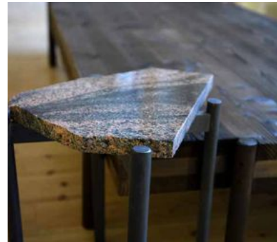
Sideboardet Sten på ben är tillverkat av spillbitar från exklusiva bänkskivor.