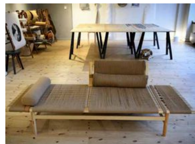
Dagbädden är i samarbete med Gabric Forest som tillverkar nya textilier från skogen. Pappersgarnet kommer från värmländska skogar och stammen är av svensk furu.