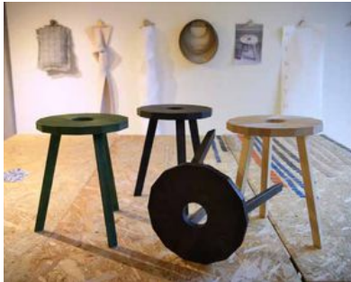
Pallen Lilla Snåland är tillverkad av det som blir över i produktionen av stolen Lilla Åland.