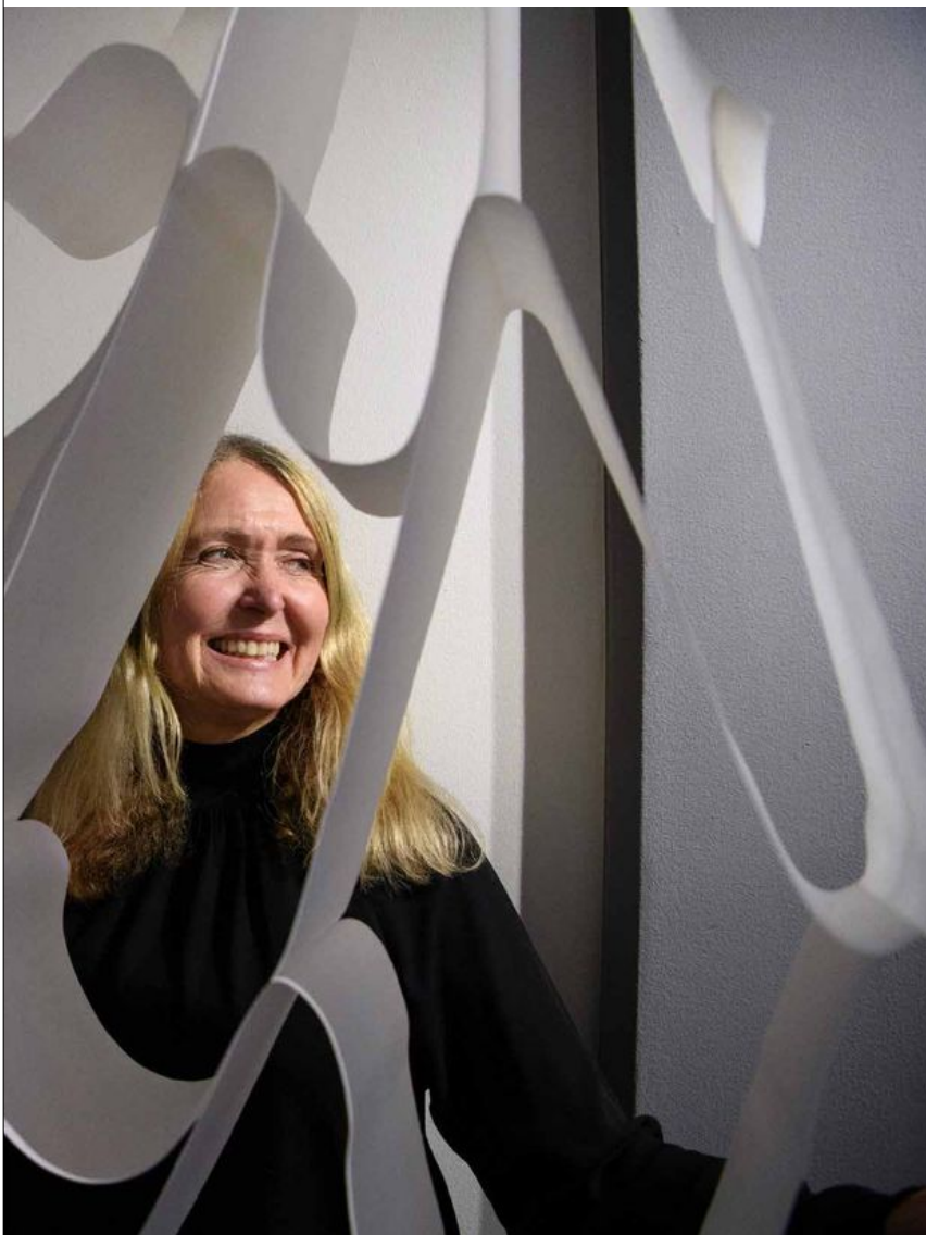
av cirka 3000 meter drop paper, en typ av fiberduk.