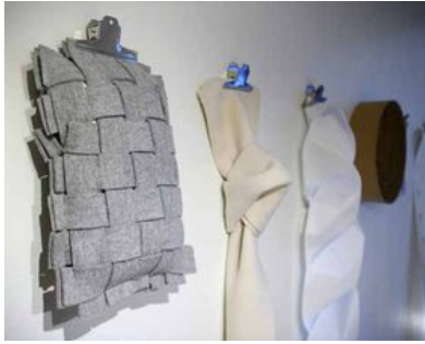
Kudden är ett experiment och är gjord av restprodukterna från tillverkningen av ullsulor.