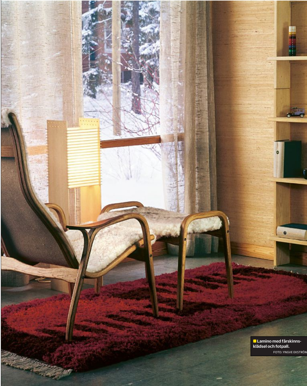
■ Lamino med fårskinnsklädsel och fotpall. FOTO: YNGVE EKSTRÖM

Den som inte har någon adress för tillfället bör kontakta Skatteverket.