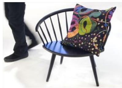
Pinnstolen Arka är fortfarande populär.