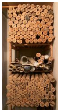
Yngve Ekströms idéer staplade i ett källarförråd i Swedeses fabriik i Vaggeryd.

– Att de vågade starta eget utan att ha någon formell utbildning beror dels på att