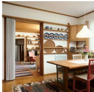
Familjen Ekströms hem i Vaggeryd möblerades med prototyper av hyllor, bord och soffor.