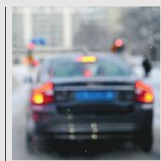
Dålig syn kan vara ett problem för äldre bilförare.

Källor: NTF, Trafiksäkerhetsverket, Tania Dukic Willstrand.