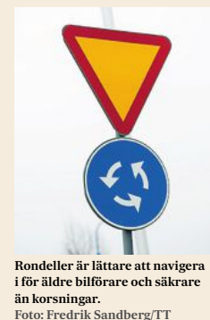
Rondeller är lättare att navigera i för äldre bilförare och säkrare än korsningar. Foto: Fredrik Sandberg/TT

Trafiken ska fungera för alla – oavsett om vi är fotgängare eller bilförare. Foto: Fredrik Sandberg/TT