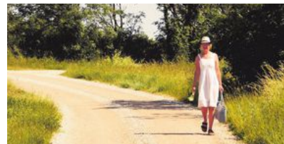
Trafikbelastningen på grusvägnätet är låg, oftast mindre än 125 fordon per dygn.