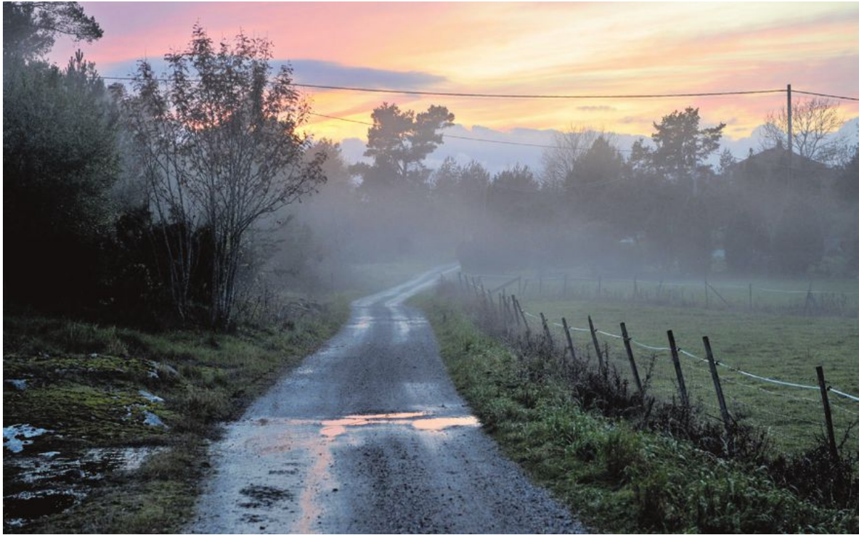
Vacker dimmig sommargrönsväg.