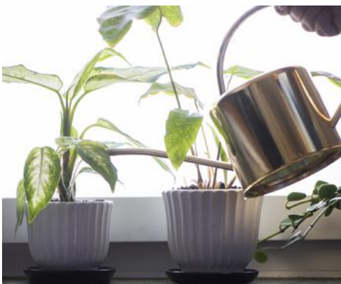
Bo Fajans kruka Tellus från 1934 är hett eftertraktad hos samlare och pryder fortfarande fönsterbrädor runt om i landet.