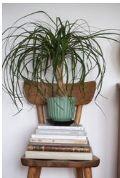
En grön kruka pryder sin plats på en fin gammal stol.