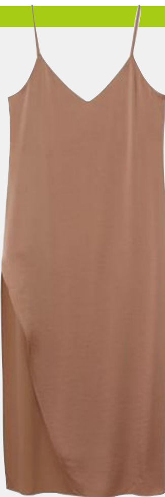
Underklänning. Slipklänning från Weekday, 650 kronor.