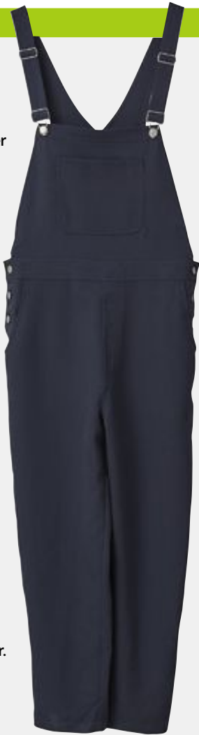
Byxor. Hängselbyxor från Ganni, 1 799 kronor.

Källor: The Guardian, Grrrlcollection.com, Mojo