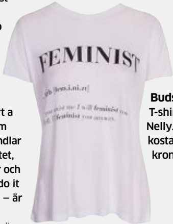
Budskap. T-shirt från Nelly.com och kostar 199 kronor.