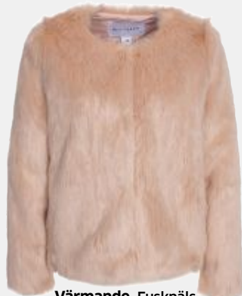
Värmande. Fuskpälss för kyliga vårkvällar från Nelly.com, 799 kronor.