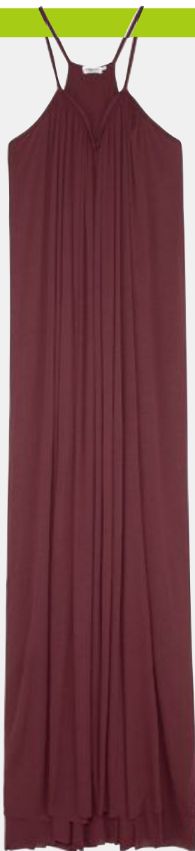
Längst. Maxidress från Filippa K, 2 300 kronor.