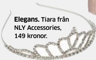
Elegans. Tiara från NLY Accessories, 149 kronor.

dragit mest till vårens 90-talsvurm. Han är alltid väldigt influerad av LA:s musikscen och dess ikoner. Och dit hör i alla högsta grad Courtney. Förra året använde Hedi Slimane sig av henne som modell i modehusets stora kampanj och nuförtiden syns hon nästan alltid i märkets exklusiva plagg.