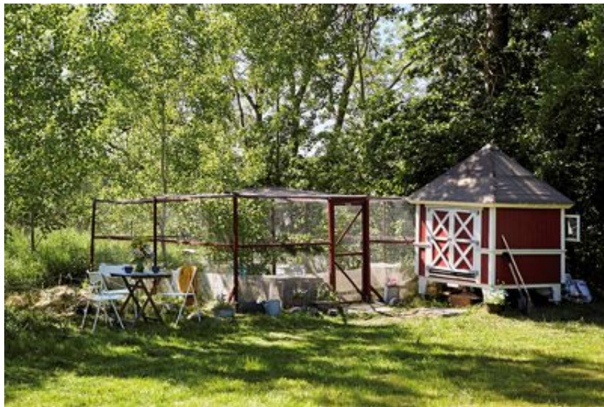
Höns är ett trevligt inslag i trädgården. Hönshuset ska vara torrt, varmt och dragfritt för att hönsen ska må bra.