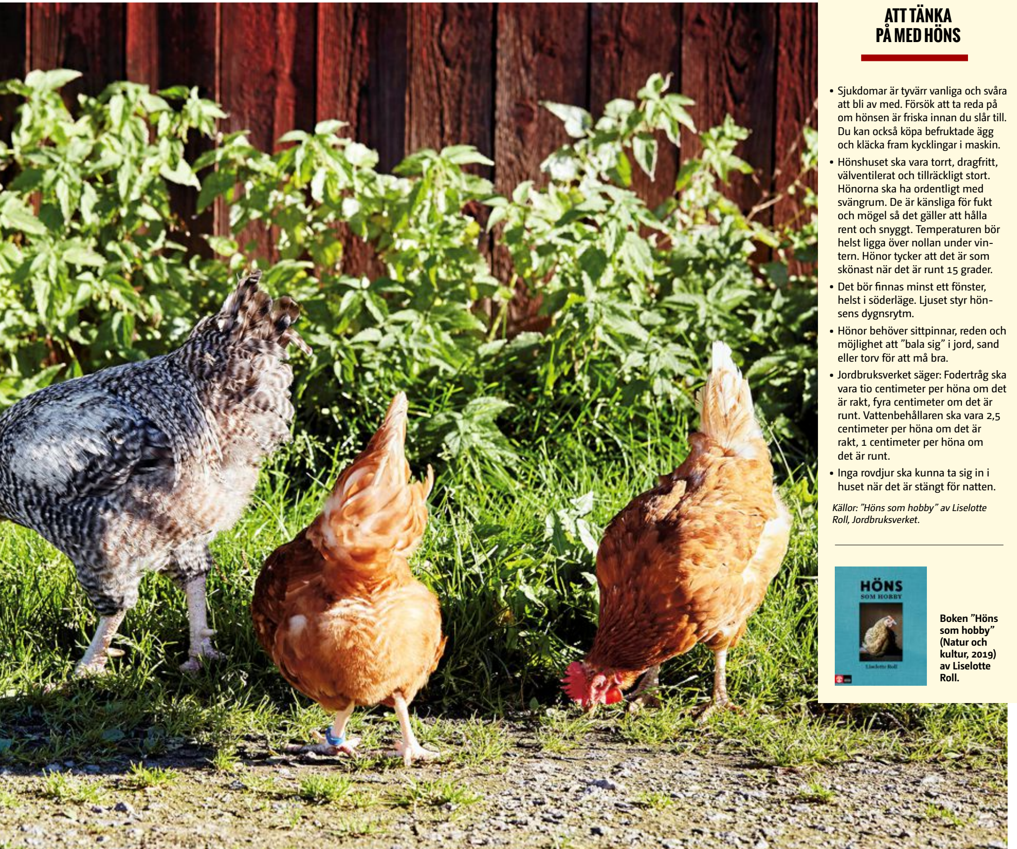
Man bör ha minst fyra hönor. Rangordningen i flocken är tydlig och det är tuppen som bestämmer. Har man ingen tupp tar en ledarhöna över som högsta hönset.