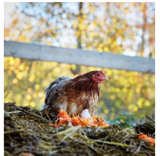
Hönor är utmärkte hjälpredor i trädgården. Med deras hjälp finfördelas komposten och förbränningen ökar.

Källa: "Höns som hobby" av Liselotte Roll.